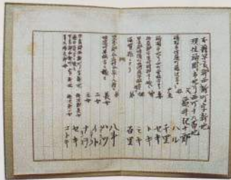
亀井家族書 (明治四十三年)

両親の納骨に当つては、亀井家累代のお墓に葬ることも慮んばかつた様ですが、戦中の事でもあり宗教の違い、神道と佛教とのことなど……。取り敢えず市の共同墓地に葬つた様です。