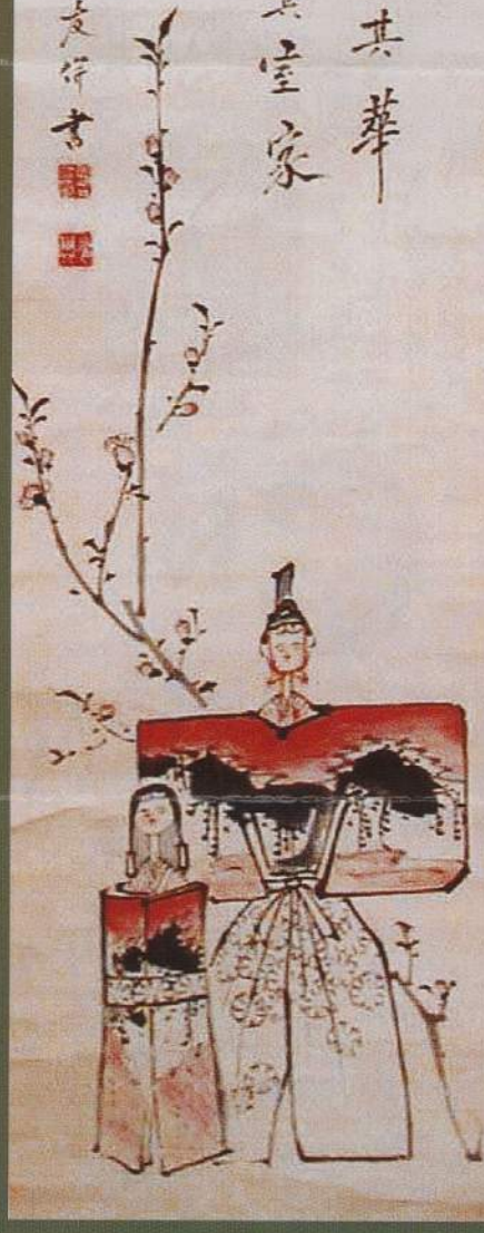
少葉 桃節句図 (掛幅)